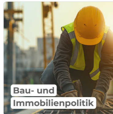
Bau- und Immobilienpolitik