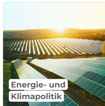
Energie- und Klimapolitik