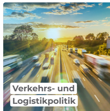
Verkehrs- und Logistikpolitik