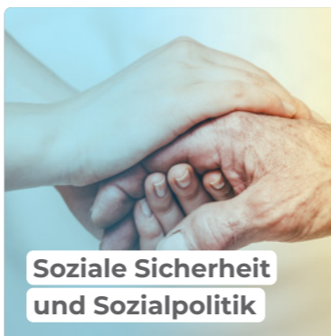
Soziale Sicherheit und Sozialpolitik