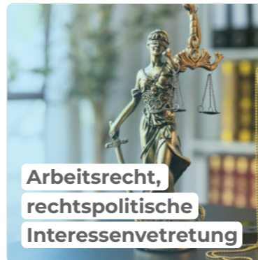
Arbeitsrecht, rechtspolitische Interessenvertretung