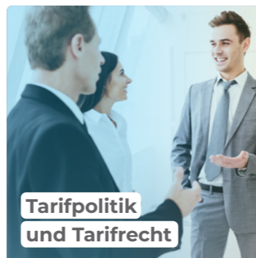
Tarifpolitik und Tarifrecht